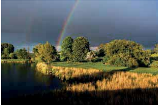
1. Platz der Kategorie „Natur“ zum Fotowettbewerb „Stadt-Land-Fluss“, Typisch Niederrhein 2013 „Abendstimmung am Breijpott Teich“