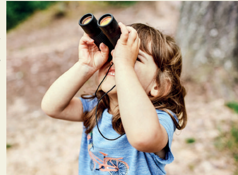
Text: Annika Horstck, VDN; Bilder: VDN, NP Fläming/D. Ludley, NP Soonwald-Nahe