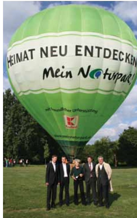
Taufe des Heißluftballons in der Bonner Rheinaue.

Im Naturpark Nordeifel stellt Heino seinen Lieblingsort vor: „Als Natur verbundener Mensch lebe ich nun schon seit über 30 Jahren in dem schönen Eifel-Städtchen Bad Münstereifel. Der Naturpark ist eine große Bereicherung für unsere Region.“ Und Wissenschaftsjournalist Jean Pütz setzt sich als Pate der Narzissenwiesen für diese regionale Besonderheit ein: „Als Pate der Eifeler Narzissen kann ich nur jeden einladen, diese wunderbare Landschaft im Naturpark zu besuchen und deren Schönheit zu genießen.“