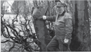
Barrierefreie Wege sind ein wichtiger Bestandteil der Landschaftspflege und werden in der Region Nordeifel gepflegt. (Ulrike Wittenberg)

4000 Jahre lang haben sich Menschen im Raum um den Rhein und die Mosel angesiedelt. In Form der Flurhecken der Region gibt es seit dem Mittelalter keine andere Hecke als die Flurhecke. Diese sind nicht nur als Landschaftsmerkmal, sondern auch als Lebensgrundlage für viele Arten zu verstehen. Die Flurhecken sind ein wichtiger Bestandteil der Kulturlandschaft und tragen zur Artenvielfalt bei. Sie sind auch ein wichtiger Bestandteil der Landschaftspflege und werden in der Region Nordeifel gepflegt.