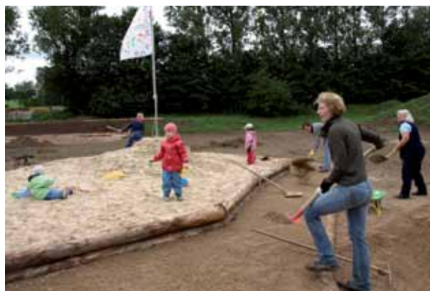
Viele Bürger beteiligen sich an den Bauarbeiten am „Generationenpark“ in Dahlem-Schmidtheim.

Das Regionalmanagement hat einen Arbeitskreis „Generationenplätze“ im Maßnahmenbereich „Eifeler Lebens- und Arbeitswelt“ initiiert. Ziel war die Schaffung neuartiger, dem demographischen Wandel in der Eifel angepasster öffentlicher Plätze, welche generationenübergreifend Aufenthalt, Aktivitäten und Kommunikation ermöglichen. Der Arbeitskreis hat Projektauswahlkriterien definiert.