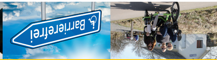
Der barrierefreie Freizeitspaß für Alle

Start Monschau-Imgenbroich HIMO → Richtung Konzen → vierte Straße links in die „Hätzevennstraße“ → über den Fahrradweg auf der linken Seite → am Ende noch weitere 75 Meter geradeaus (nicht der Straße folgen) → links auf die „Vennbahn“ Richtung Luxemburg | Belgien (Knotenpunkt 25) durch das „Hätzevenn“ → Bahnhof Monschau → Grillhütte Mützenich → Viadukt von Reichenstein → weiter Richtung Kalterherberg → Küchelscheid, Leykaul → nach Küchelscheid gelangt man zum wildromantischen Oberlauf der Rur, nach ein paar Kilometern sollte spätestens gedreht werden, damit die Elektrounterstützung auch für den Rückweg ausreicht.