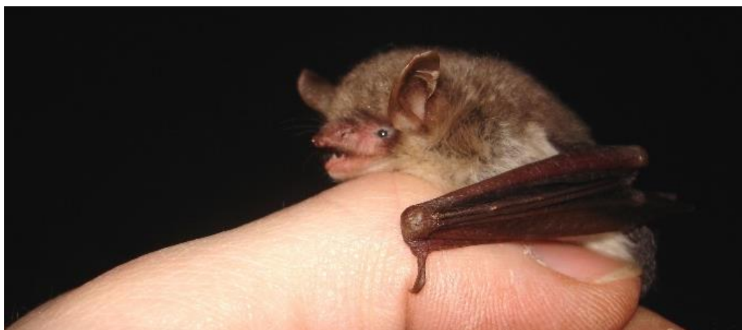
Abb. 2 Myotis nattereri

« La protection des chauves-souris nécessite à la fois le soutien financier et l'engagement de bénévoles et d'intervenants passionnés et qui, en plus de leur dynamisme, apportent également leur expertise ! »