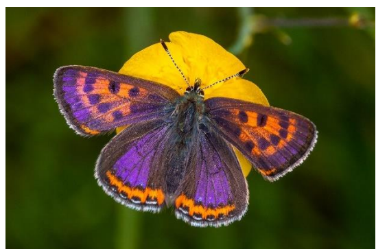
à gauche: femelle, à droite: mâle